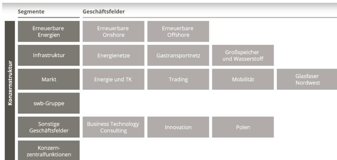
Abbildung 1 - Geschäftsbereiche des EWE-Konzerns (Stand 2022)

Eine Darstellung der Geschäftsbereiche des Gesamtkonzerns während des Berichtszeitraums mit seinen wesentlichen Tochtergesellschaften sowie den assoziierten Unternehmen ist im nachfolgenden Organigramm dargestellt: